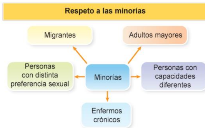
Imagen 2 Respeto a las minorías

Cada una de estas opciones conlleva posiciones morales diferentes que resulta complejo. Moralmente la regulación de la interrupción de embarazo debe justificarse por la teoría del mal menor y socialmente ha de considerarse un fracaso y un estímulo para prevenir embarazos no deseados.