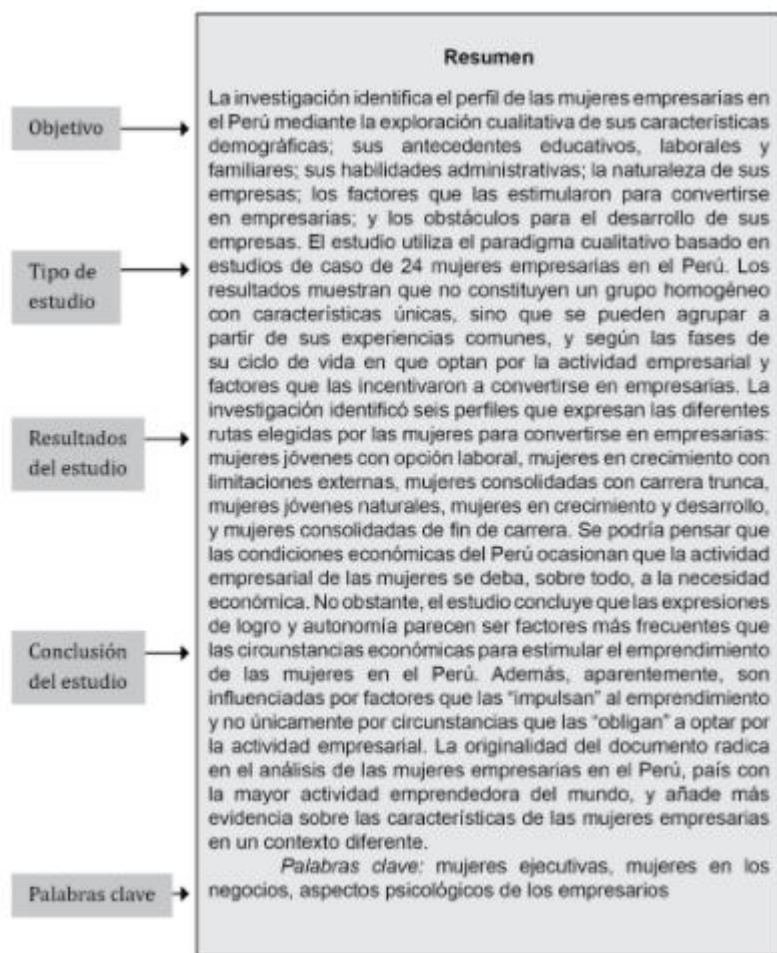
Figura 2. Ejemplo de resumen en estudios cualitativos.

En el caso de tipos de estudios cualitativos, la estructura del resumen, en sus posibles variantes, presenta características similares a las de los tipos de estudios cuantitativos, donde se brinda un panorama general de lo que se presentará en la investigación. (véase figura 2). (Arias y Cangalaya, 2021, pp. 113 - 114)