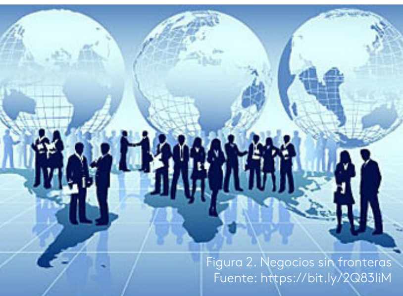
Figura 2. Negocios sin fronteras

Estas son algunas de las exigencias para poder competir en el entorno actual: