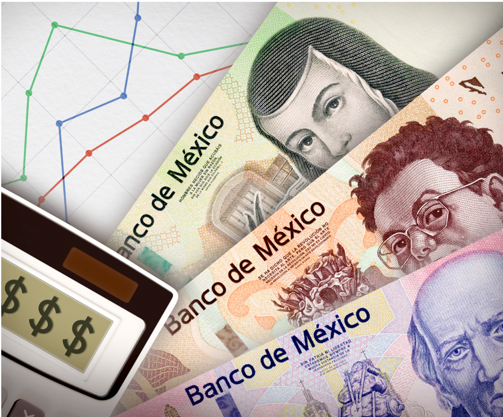
Figura 12.