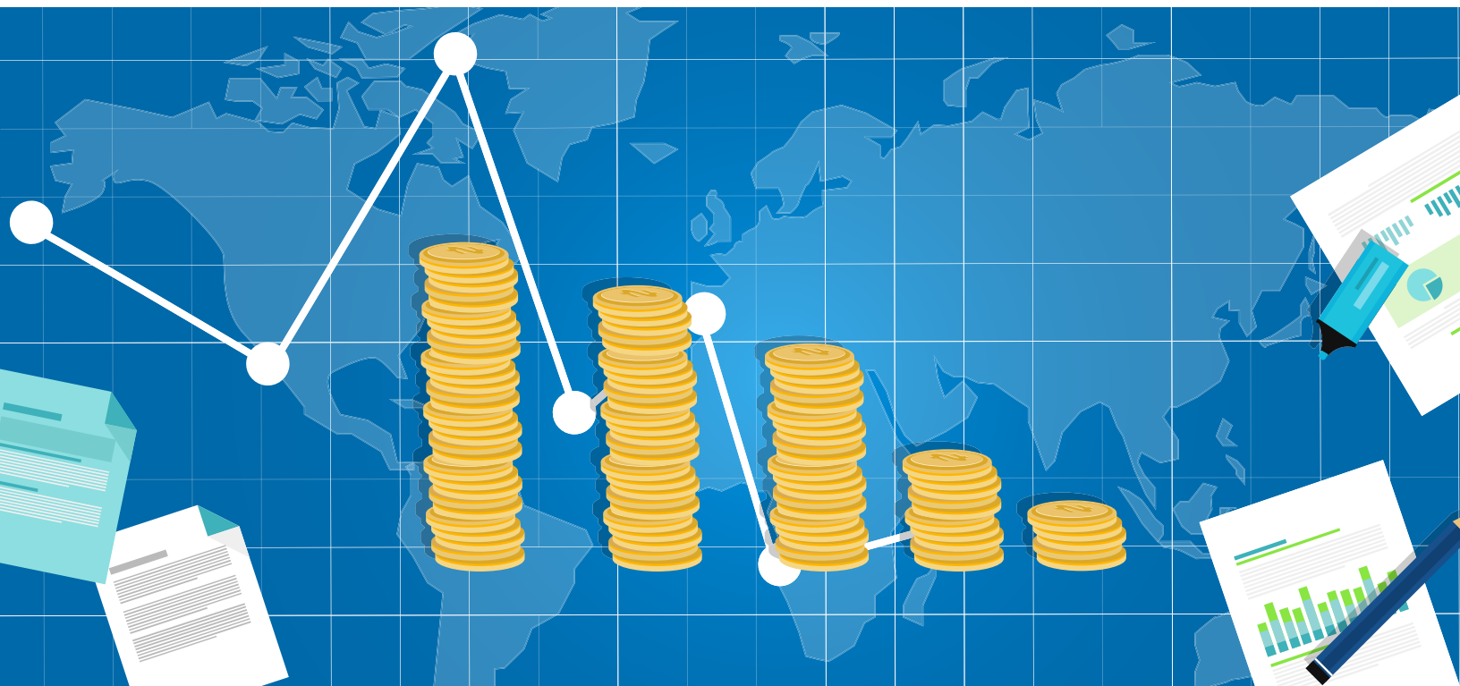
Figura 10.