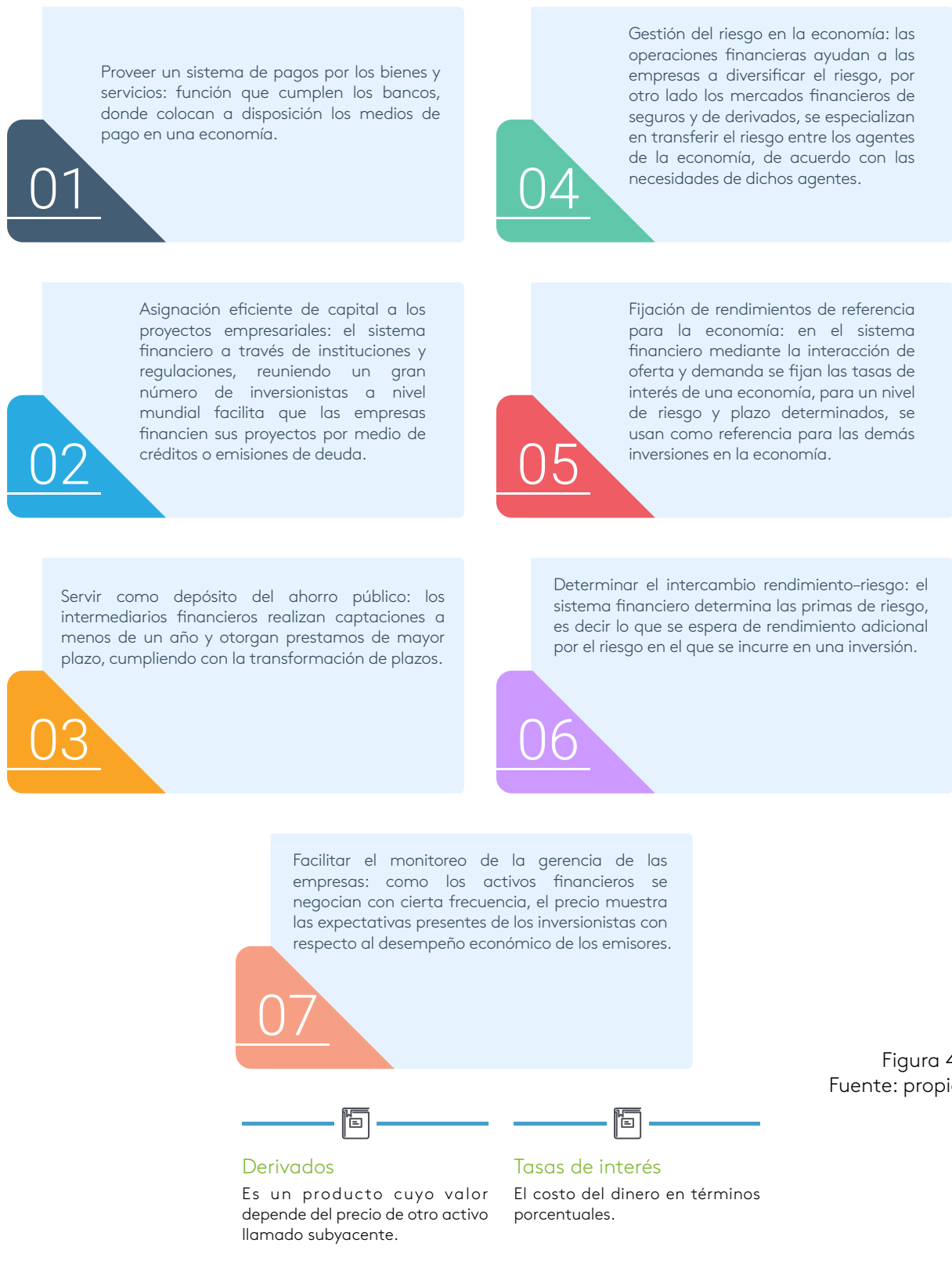
Figura 4.

Cuando se habla de los actores del sistema financiero y la función de este, es importante resaltar que el servicio que presta a una nación, está dado en sus funciones económicas como lo son: (Agudelo, 2014).