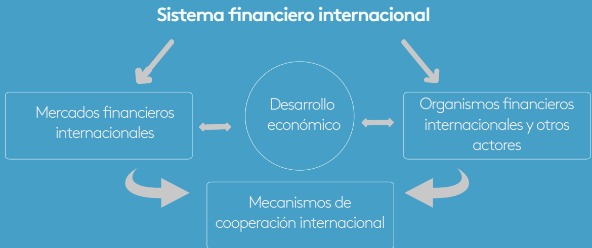
Figura 1. Elementos a desarrollar analicemos la situación