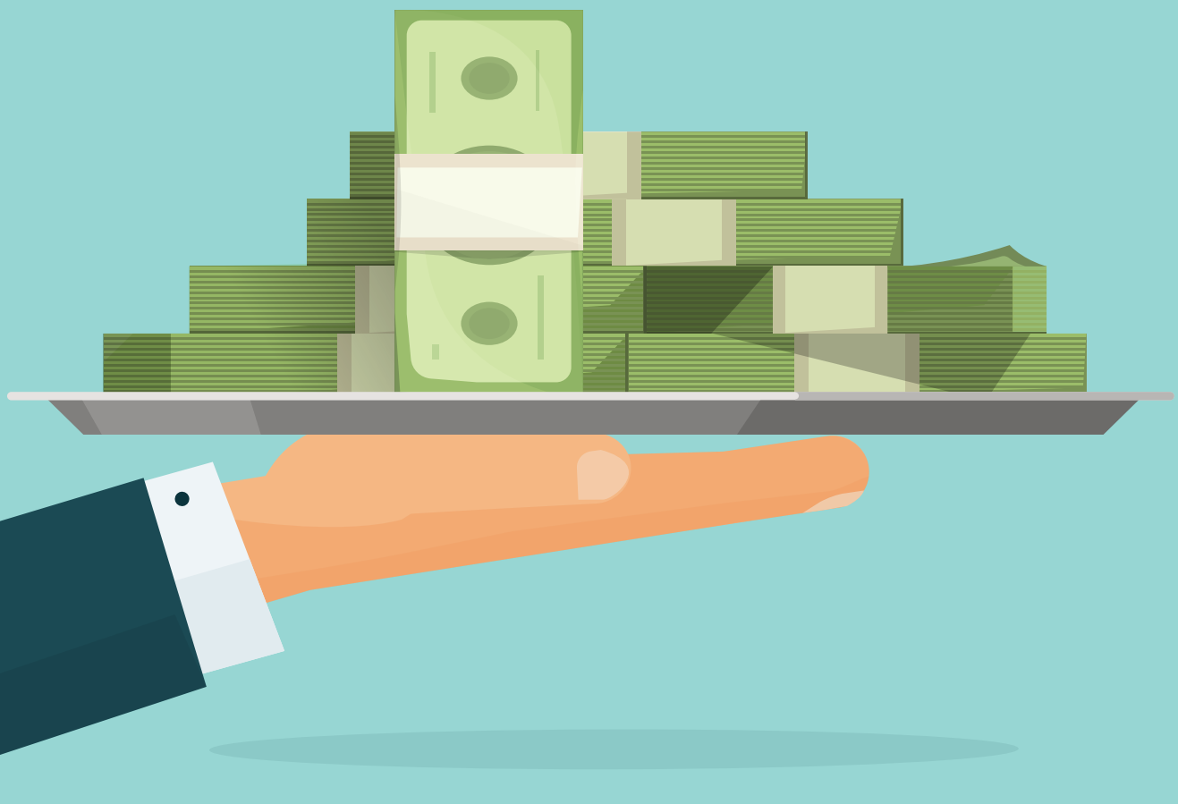
Figura 11.