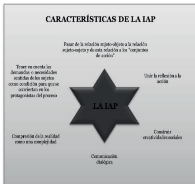
Figura 5. IAP

Construir reflexividades colectivas: La reflexividad sobre la acción o la praxis puede no ser suficiente. A lo mejor necesitamos generar reflexividades colectivas. Una sociedad como la nuestra necesita pensarse colectivamente. De hecho, la gran mayoría de los saberes son colectivos, son construcciones del mundo de lo cotidiano. Toda reflexividad colectiva proviene de una comunicación dialógica, de las creatividades sociales, de la unión de la reflexión a la acción, pero de forma colectiva y de los conjuntos de acción. Cuando hablamos de reflexividad colectiva nos estamos refiriendo a la capacidad de los sujetos para comprender/construir/deconstruir su propia realidad. O, diciéndolo de otra manera, “la realidad” es el producto de las reflexividades colectivas.