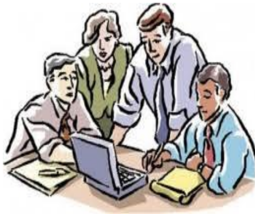
Figura 1. Investigación social