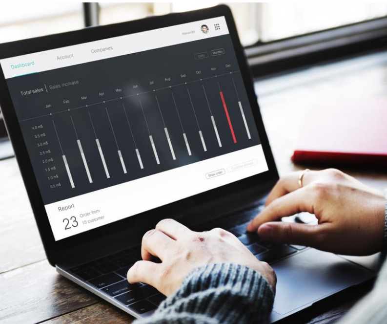
Figura 9.

En este momento del estudio de caso, es importante dar cuenta de las fases que nos indican: