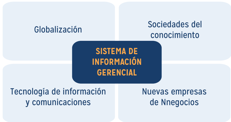
Imagen 1: Surgimiento de los Sistemas de información Gerencial

Diversos autores basan al surgimiento o desarrollo del concepto de los sistemas de información en base a hitos que surgieron a nivel mundial.