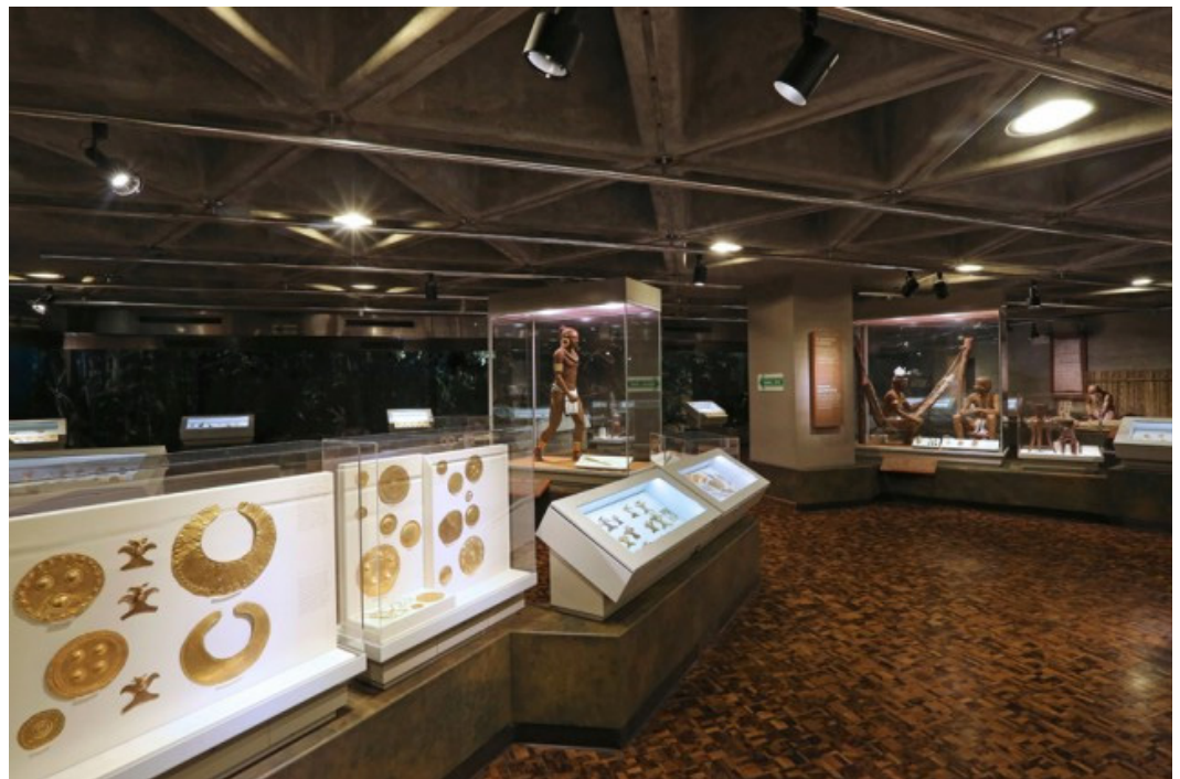
Figura 3. Collares y demás accesorios hechos y utilizados por los indígenas de Costa Rica.