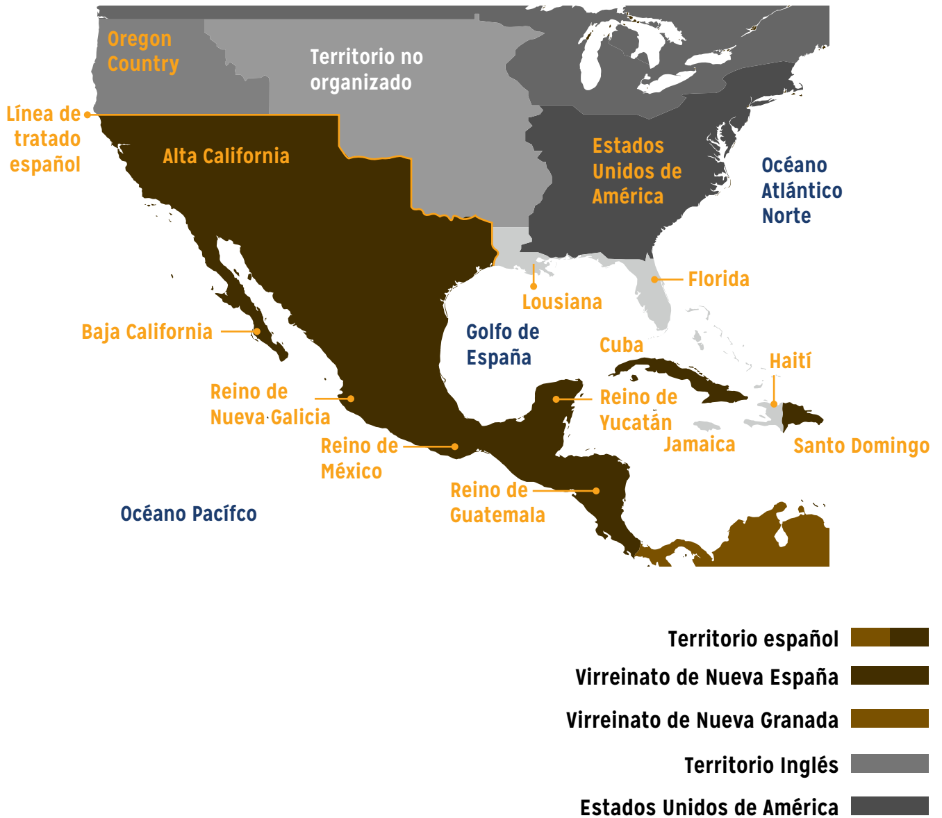
Figura 6. Territorios del Virreinato de Nueva España en 1819. Nota: Giggette (2013), Elaboración propia con base en: https://es.wikipedia.org/wiki/Virreinato_de_Nueva_Espa%C3%B1a#/media/File:Viceroyalty_of_the_New_Spain_1819_%28without_Philippines%29.png