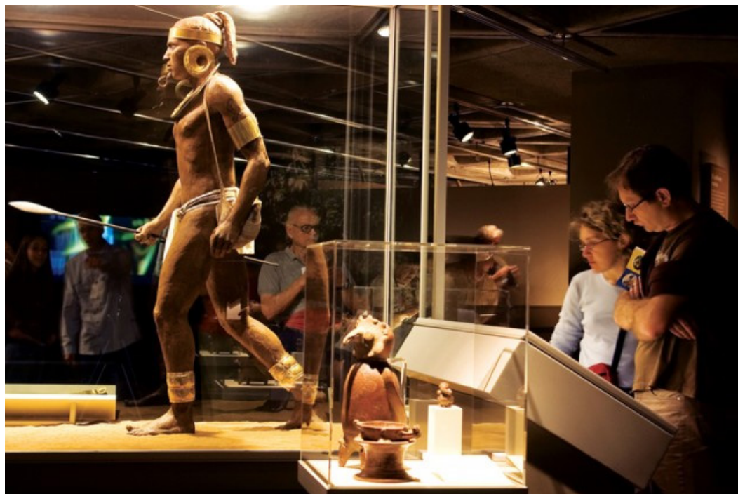
Figura 2. Accesorios de oro utilizados por los indígenas de Costa Rica Nota: Es probable que así lucieran los indígenas del Caribe y Pacífico Sur para la llegada de los españoles.