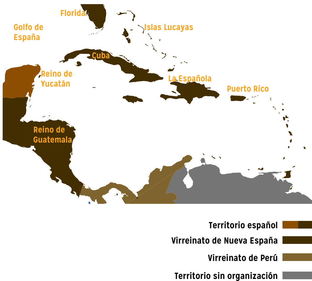
Figura 7. Capitanía o Reino de Guatemala en 1600. Nota: Giggette (2014), Elaboración propia con base en: https://es.wikipedia.org/wiki/Capitan%C3%ADa_General_de_Guatemala#/media/File:Spanish_Caribbean_Islands_in_the_American_Viceroyalties_1600.png