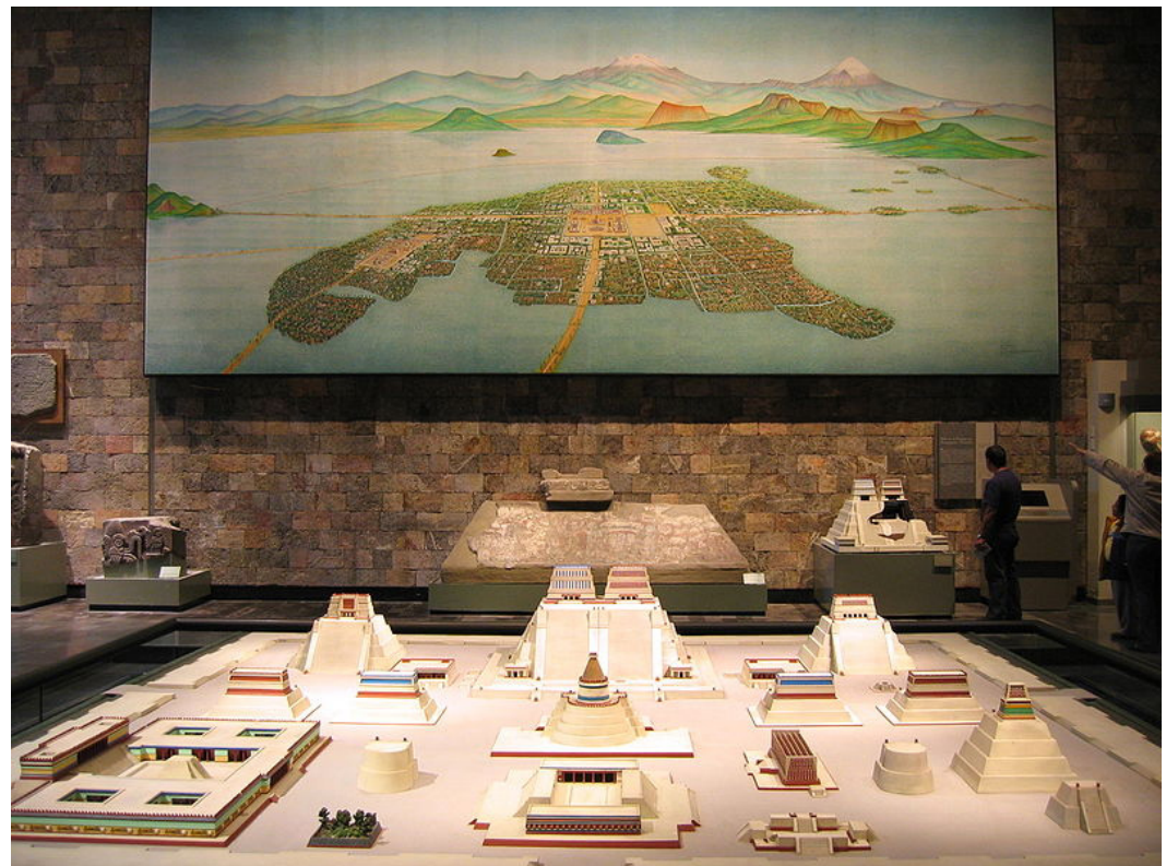
Figura 4. Pintura de la ciudad Tenochtitlán y maqueta del Templo Mayor.

El anhelo de riqueza condujo a un tipo de comportamiento social dominante de parte de los españoles con respecto a la tierra y los recursos que iban descubriendo, incluyendo las poblaciones indígenas que habitaban el continente americano. Las empresas de exploración se transformaron en empresas de conquista, caracterizadas por el sometimiento y explotación del pueblo débil, apoyado en una clara superioridad militar y tecnológica. Para la década de 1580, España tenía el mayor imperio establecido sobre la faz de la tierra (Arias, 2007).