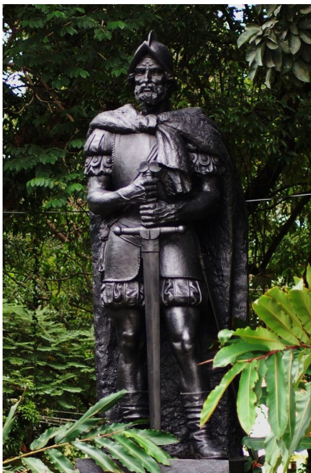
Figura 5. Estatua del conquistador Juan Vázquez de Coronado. Nota: Ubicada en el Parque España en el centro de San José. Uno de los cantones de la provincia San José lleva su nombre. Statues and sculptures (2012), Recuperada de: http://www.statues-sculptures.net/picture/number313.asp

En 1563 es nombrado Alcalde Mayor de Costa Rica, efectuando una serie de expediciones de exploración y reconocimiento de las tribus indígenas existentes, recorriendo Nicoya, Quepos, Coto, Pacaca, Talamanca, el Río de la Estrella y la región de Pococí (Arias, 2007). Con su ausencia, los soldados españoles iniciaron la represión de los indígenas, quienes se rebelaron bajo el mando del cacique Turichiquí de Ujarrás, y sitiaron Cartago en 1566.