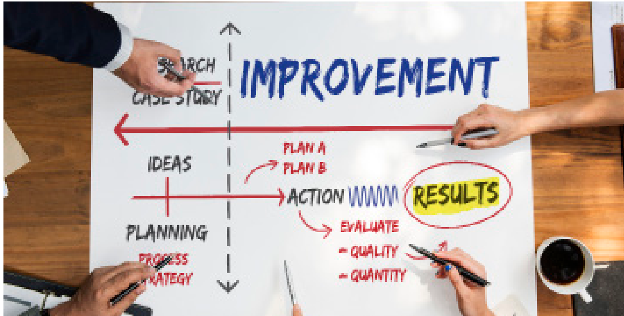
Figura 12. Evaluación

El exceso de concentración de la riqueza en el mundo y las necesidades en gran parte de la población mundial, son una paradoja inaceptable donde las grandes organizaciones sociales, las organizaciones de Derechos Humanos, las Naciones Unidas, entre otras; deben involucrarse activamente para regular esta condición de desigualdad.