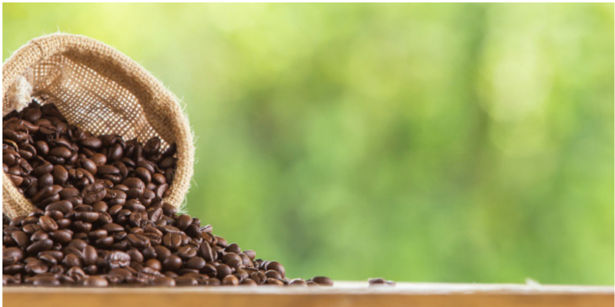
Figura 2. Café colombiano

De la misma forma, diferentes países del mundo consumen nuestros recursos naturales como el café, las flores, banano, petróleo; exportamos servicios de energía para algunos países de la región, realizamos alianzas con las cadenas internacionales de grandes superficies que incluyan la venta de productos colombianos o de otros países.