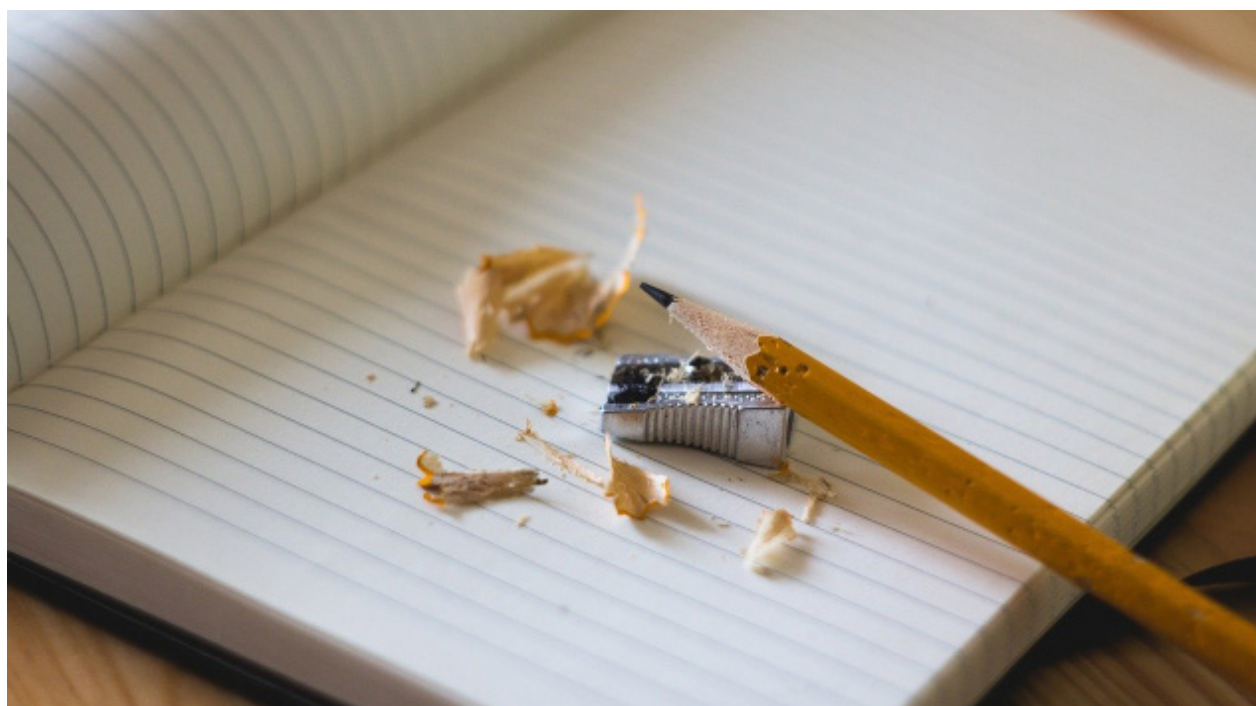
Figura 6. Educación

En general, si tomamos en cuenta que la educación está orientada hacia el desarrollo y la capacidad intelectual, moral y afectiva de una población, sobre unos parámetros de convivencia basados en una cultura que se construye a partir de sus ancestros, su historia, las costumbres, los valores y los principios, con el fin de alcanzar un desarrollo integral, dentro de un contexto territorial y bajo un esquema de gobierno donde se procura el respeto por los demás, la seguridad, la salud y demás aspectos relacionados.