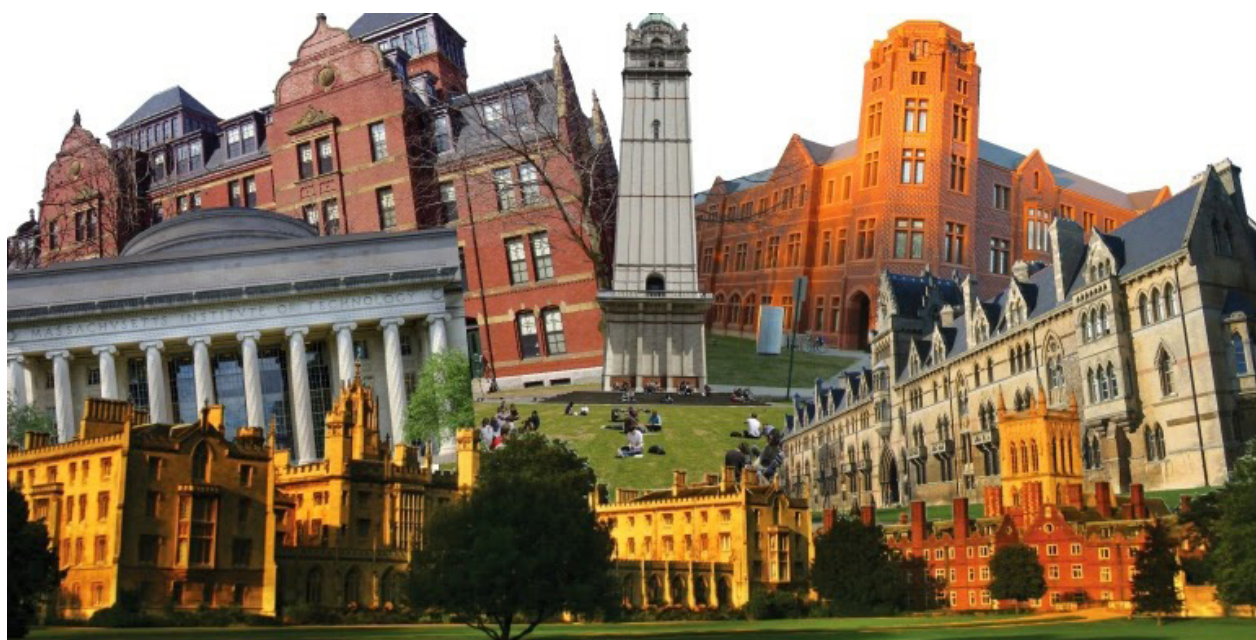
Figura 7. Las universidades y la globalización.

A partir de esta reflexión, las universidades en el mundo enfrentan un gran desafío que, alineados con los perfiles de profesionales requeridos por las grandes multinacionales, deben redefinir de manera permanente los contenidos programáticos, los modelos educativos y desarrollar capacidades para dar una lectura al entorno y a la dinámica impuesta por el proceso de globalización.