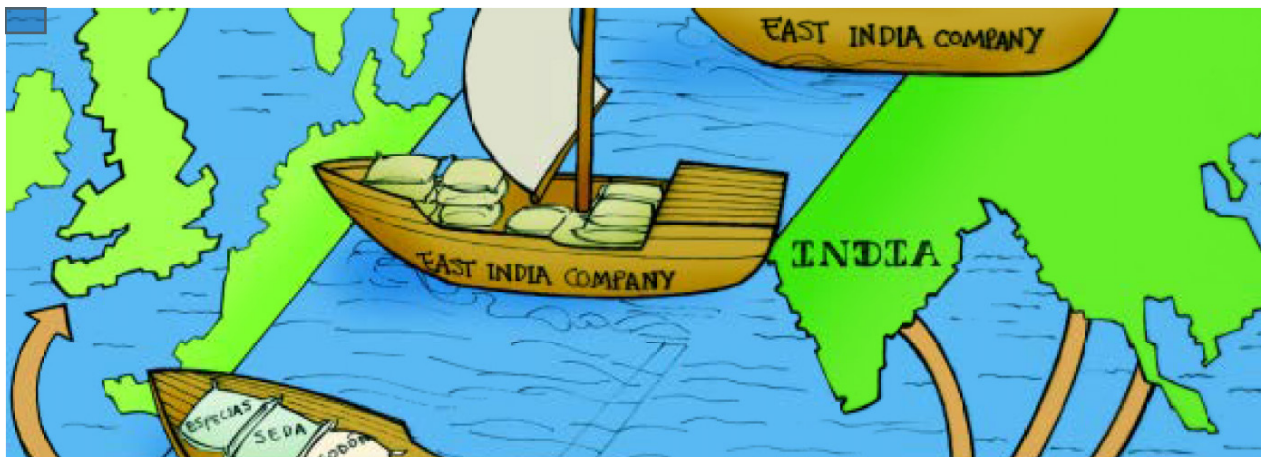
Figura 3. East India Company

El proceso de conquista y colonización llevado a cabo por las grandes potencias europeas entre los siglos XV y XIX respondió a una lógica económica según la cual se buscaba incrementar el comercio de bienes y servicios, así como obtener metales preciosos y materia prima, y consolidar empresas comerciales en las colonias.