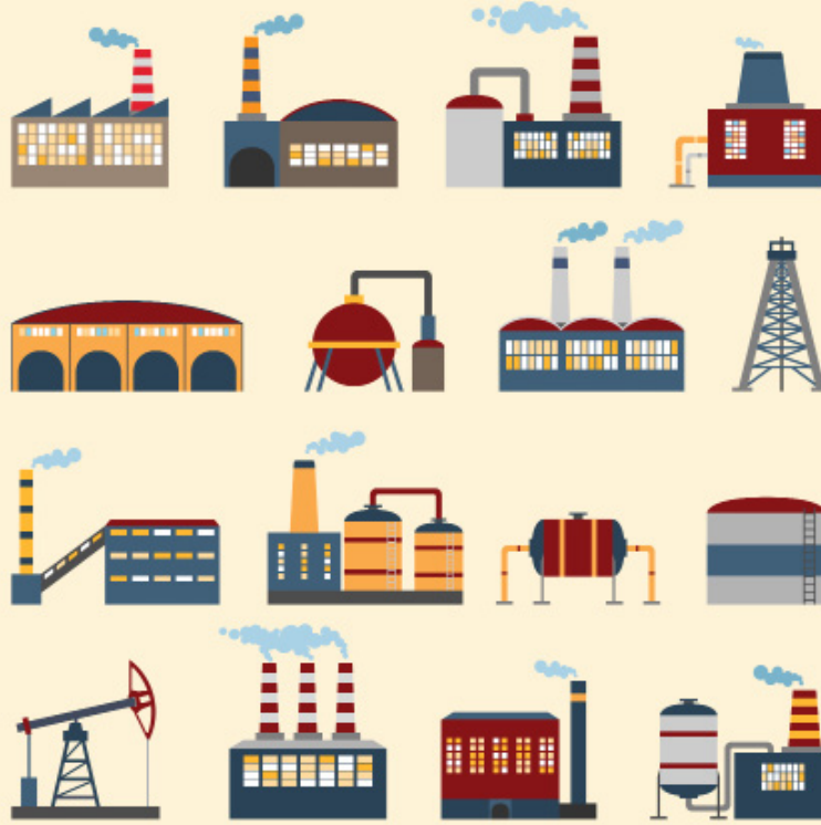
Figura 1. Evolución industrial

Respecto del proceso de globalización, existe innumerable literatura que proviene de la reseña de los hechos históricos en que se establecen las primeras relaciones comerciales entre grupos sociales, posteriormente cómo estos procesos migraron a otros países, generados por las necesidades internas y la capacidad de producción interna de bienes y servicios con una alta demanda de consumo en otros países, la concentración de capital y la conformación de grandes grupos económicos y con una marcada influencia sobre los gobiernos, que se manifestaba de diferentes formas traducidas en ventajas hacia el desarrollo y el bienestar de las personas.