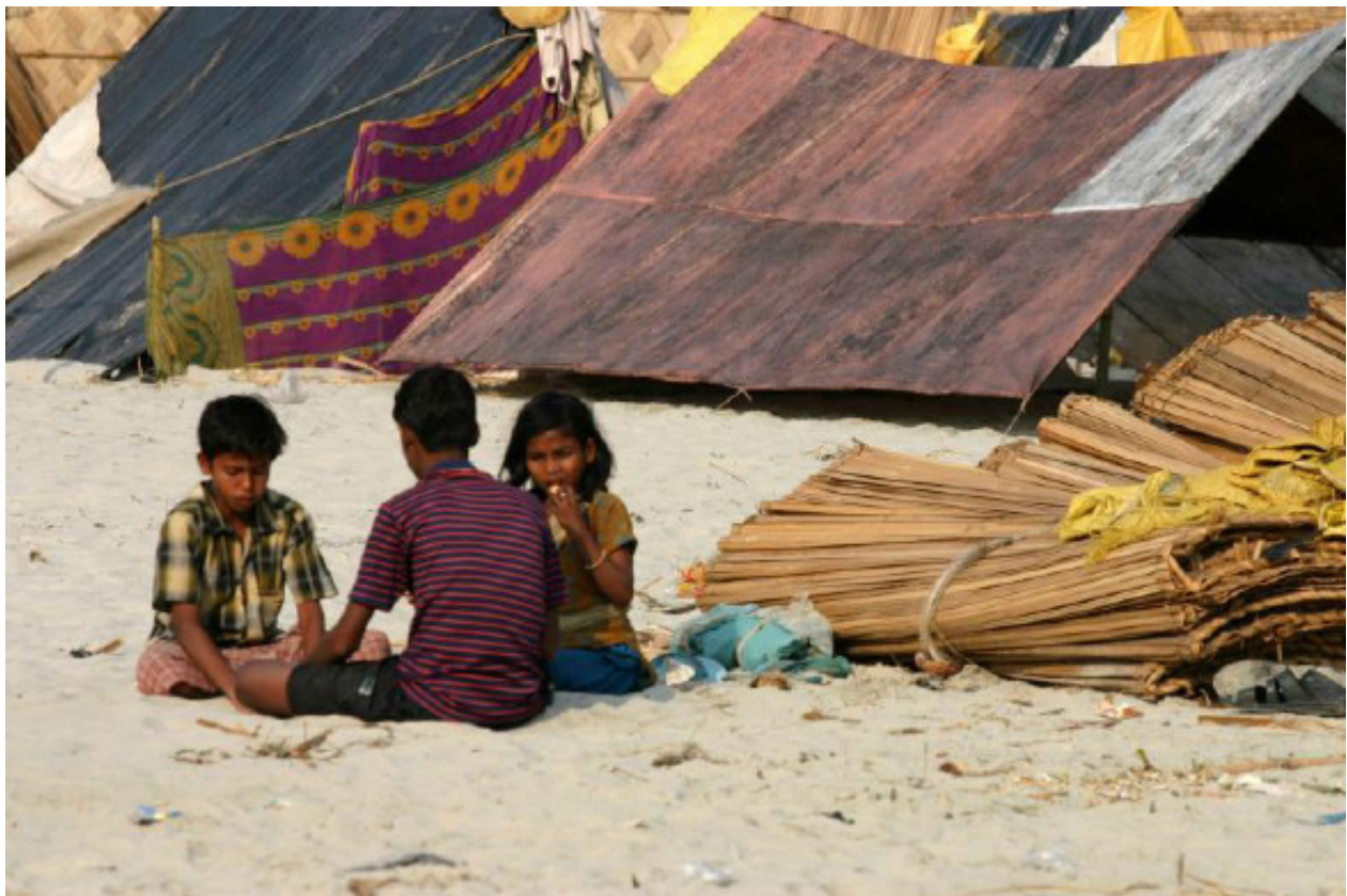
Figura 9. Pobreza

Es evidente que el proceso de globalización representa grandes beneficios para los globalizadores, excesivo aumento de bienes, perfeccionamiento de la técnica sin antecedentes en los países desarrollados y en general para las potencias mundiales, reconocidos como los más ricos y con mayor influencia a través del poder económico global. Paralelamente, el desequilibrio generado por el proceso de globalización para los países emergentes, que se refleja en el aumento de los indicadores de pobreza, aumento de los índices de desempleo, detrimento en el sistema de salud, la falta de medicamentos, bajo nivel de vida y la poca capacidad económica para la compra de alimentos, es un factor que refleja una realidad no deseada dentro del proceso.