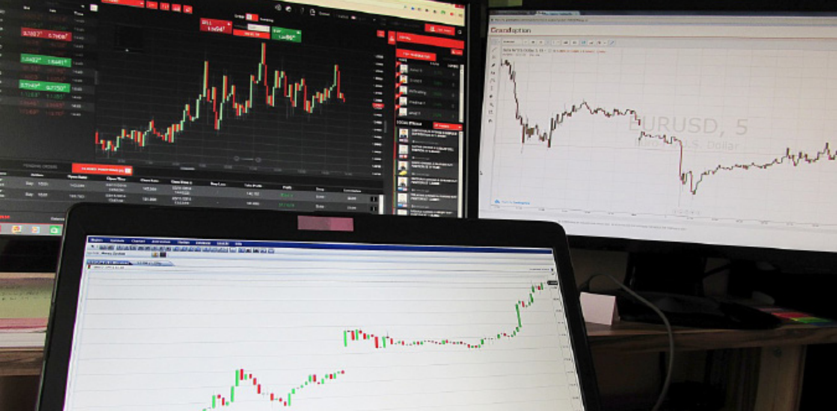
Figura 11. Divisas