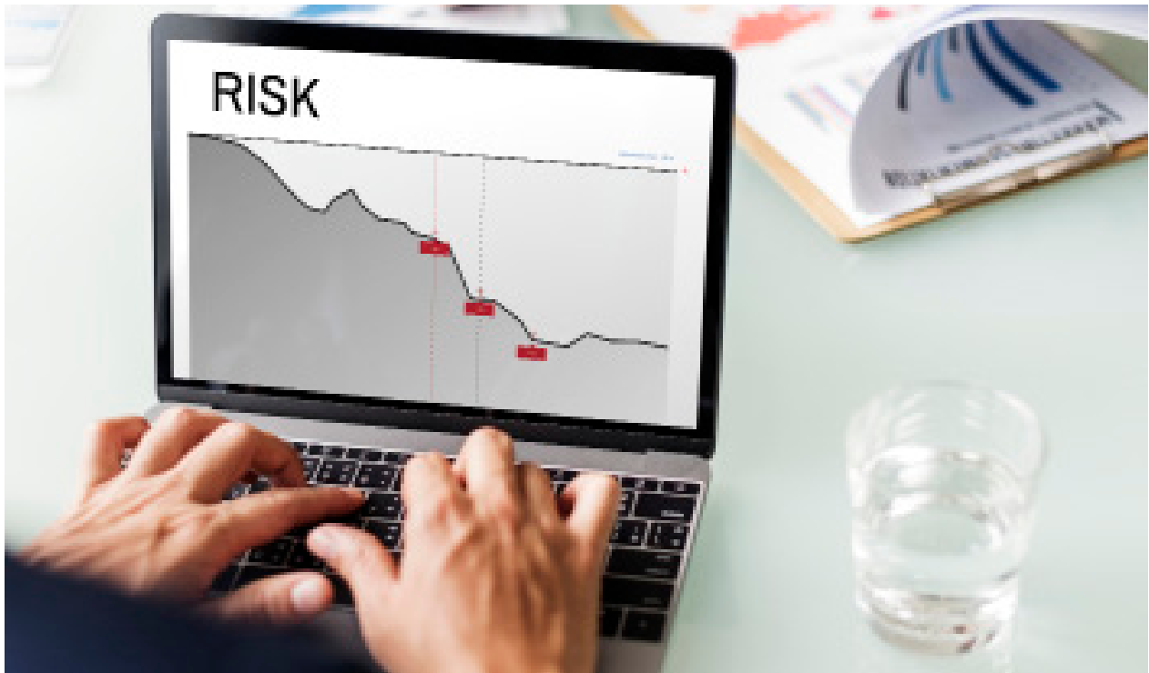
Figura 5. Riesgos