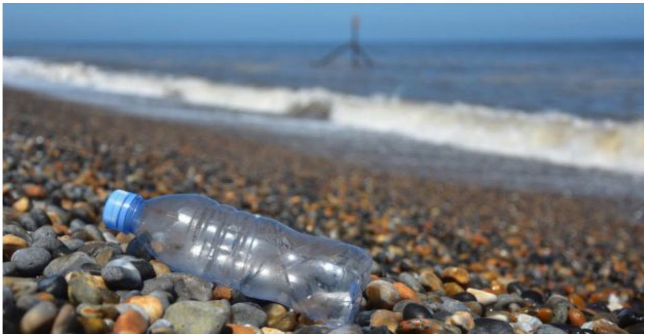
Figura 8.Utilización del plástico

El proceso de globalización en el mundo y en particular la industrialización masiva de productos, utilizan el plástico como un envase de muchos productos en el mercado de alimentos, las industrias farmacéuticas, fabricación de utensilios. Para 2018, el 90.5 % representa la proporción de residuos plásticos que nunca fueron reciclados. Alrededor del 30 % del plástico producido en todo el mundo todavía está en uso. De la cantidad restante (estimada en 6.300 millones de toneladas métricas), se calcula que el 90,5 % nunca fue reciclado, mientras que solo el 9,5 % sí obtuvo el tratamiento correspondiente.