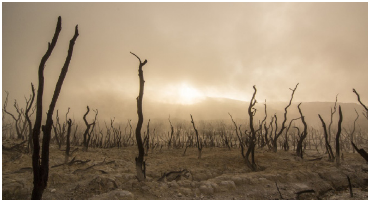
Figura 10. Devastación

El mercado global utiliza para su desarrollo recursos naturales y generan un desastre ecológico de grandes proporciones. Las corporaciones multinacionales se instalan en su entorno de producción y se convierten en depredadores inescrupulosos de las riquezas naturales, sin consideración alguna de los daños colaterales provocados a las poblaciones locales.