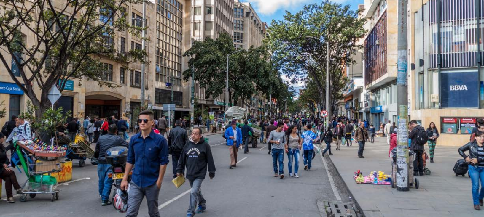
Figura 4: Carrera 7ª en Bogotá.

Este programa buscaba aumentar la capacidad de autorregulación de los ciudadanos por medio de una pedagogía del lenguaje y a la comunicación de los incentivos diseñados para tal fin.