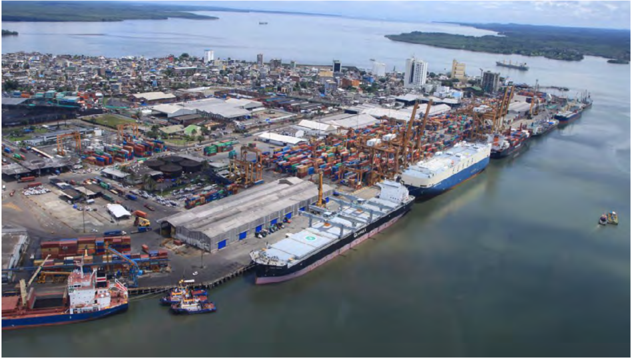
Figura 1. Puerto de Buenaventura

Casos especiales de valoración aduanera de acuerdo con el estado o la naturaleza de la mercancía: