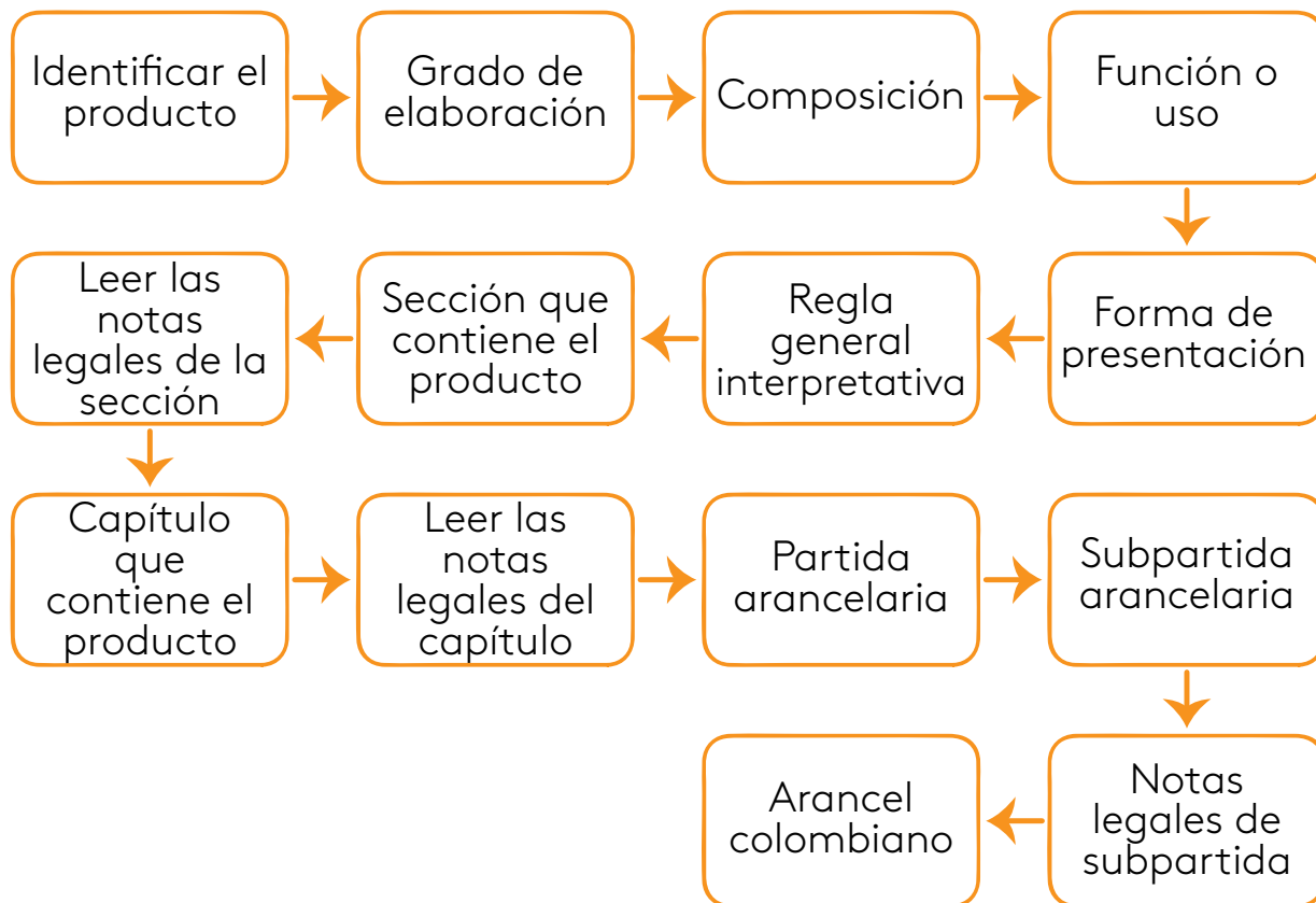
Figura 4. Procedimiento de clasificación arancelaria