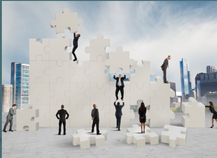
Figura 8.

En Colombia una empresa es una sociedad legalmente constituida a través de las distintas sociedades existentes, conformada unipersonal o por varias personas, con el objetivo de percibir ingresos a través de los bienes o servicios que ofrecen en el mercado.