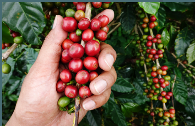
Figura 9.

El café uno de los productos de mayor exportación en el mundo, es por ello que se encuentra como uno de los indicadores, por su variabilidad en el precio diario y la competencia que mantienen países como Colombia, Brasil, Vietnam, Indonesia, México, Guatemala, Perú, Costa Rica, Ecuador, El Salvador entre otros.