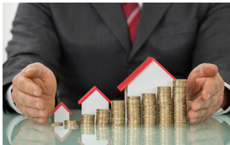
Figura 6. Representación de impuestos

Tal y como ocurrió en la tendencia del neomercantilismo, hubo un mejoramiento en los mercados extranjeros, razón que llevó a la apertura de las fronteras, donde el Gobierno ya no era radical en sus decisiones de proteger y coaccionar a las empresas.