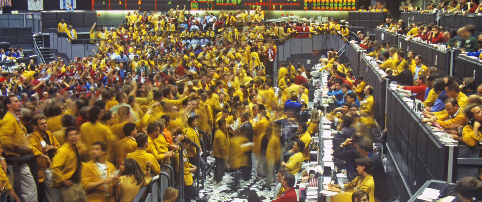
Figura 1. Trading Floor of the Chicago Mercantile Exchange, Chicago, Illinois

Con el fin de dar un contexto, se debe recordar donde apareció el mercantilismo, lo cual se establece como una corriente de pensamiento que se extiende por toda Europa entre los siglos XVI-XVII y parte del siglo XVIII. En síntesis, esta corriente mantiene la teoría que una nación es próspera, en la medida que desarrolle su comercio exterior, como base fundamental.