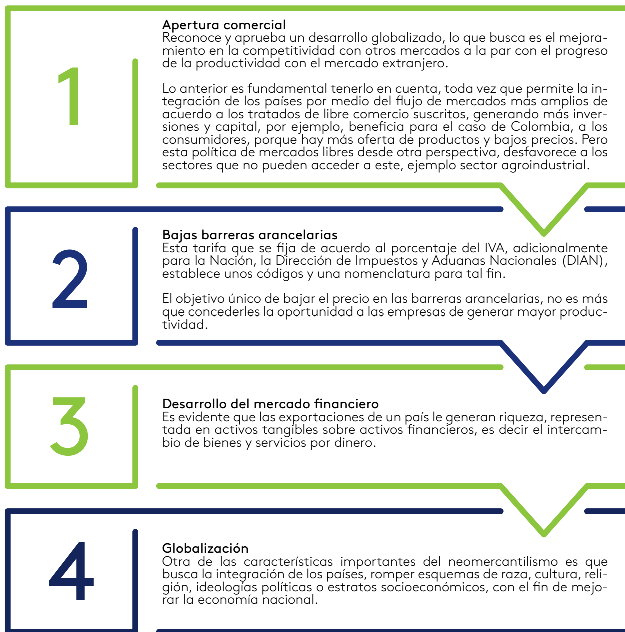
Figura 4. Características del neomercantilismo

Del neomercantilismo, se rescatan algunas características, como: