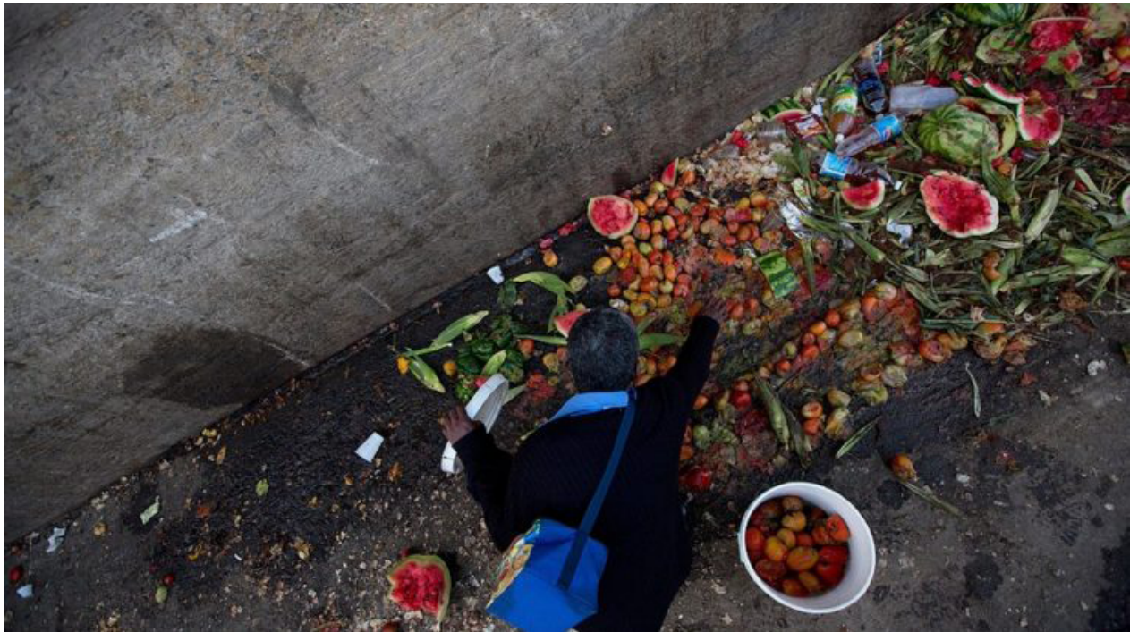
Figura 5. Imagen de la pobreza extrema que vive Venezuela