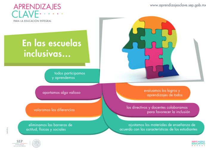
Imagen 4