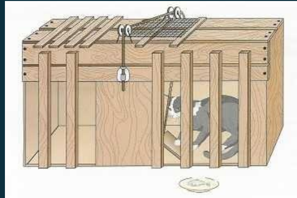
Figura 1. Representación gráfica de la caja problema empleada por Thorndike durante su investigación

Dicho estudio consistió en medir la latencia de respuesta de salida de la caja por parte del gato. Para ello, este debía accionar un mecanismo que habilitaba la apertura de la compuerta adyacente. A la salida el gato encontraría un plato de alimento. El anterior trabajo fue crucial para Thorndike, ya que a partir de sus resultados formuló uno de los principios fundamentales de su teoría del aprendizaje, conocido como la ley del efecto, que menciona que cuando un comportamiento es seguido de una consecuencia satisfactoria, se fortalecerá y aumentará la probabilidad de ocurrencia hacia el futuro, pero que si es seguido por una consecuencia desagradable se debilitará y tenderá a no volverse a presentar (Tarpy, 2000). Este principio con características hedonistas permitió comprender que las consecuencias del comportamiento tienen un efecto sobre él y abrió las puertas a investigadores posteriores que establecieron nuevos principios con la intención de comprender cómo se adquieren los comportamientos.