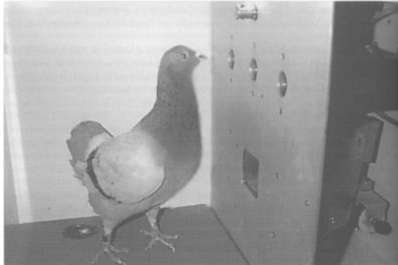
Figura 3. Caja de Skinner desarrollada para ser usada por palomas

La única diferencia importante de este dispositivo con relación al utilizado por ratas es el tamaño (es más grande) y los operandos. En este caso no se trata de palancas sino de botones (claves) a los cuales el ave picotea en función de las contingencias implementadas. Estos dispositivos fueron desarrollados para solucionar un problema metodológico importante que había en ese momento, relacionado con la forma como se estaban obteniendo los datos. Desde la época de Thorndike se desarrollaron metodologías de ensayos discretos, en las cuales solo se podía recolectar un dato por ensayo ya que este terminaba cuando el sujeto emitía la respuesta (por ejemplo, la caja problema de Thorndike o los laberintos usados por Watson).