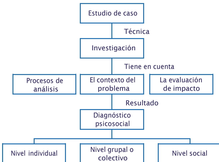
Figura 5.