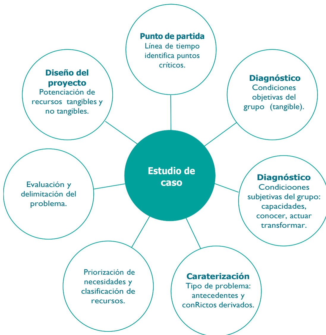
Figura 7. Campos de análisis en la técnica estudio de caso