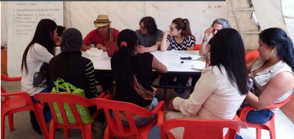
Figura 2. Grupo de indígenas EP- 2016

El campo conceptual se relaciona con las características, objetivos y acciones del objeto de análisis, preguntando aspectos del grupo como: ¿Qué es el grupo? ¿qué hace el grupo? ¿cómo se estructura el grupo? etc., es la base para un primer análisis de la situación que vive determinada agrupación de pluralidades que requiere de ser abordada desde una perspectiva psicosocial.