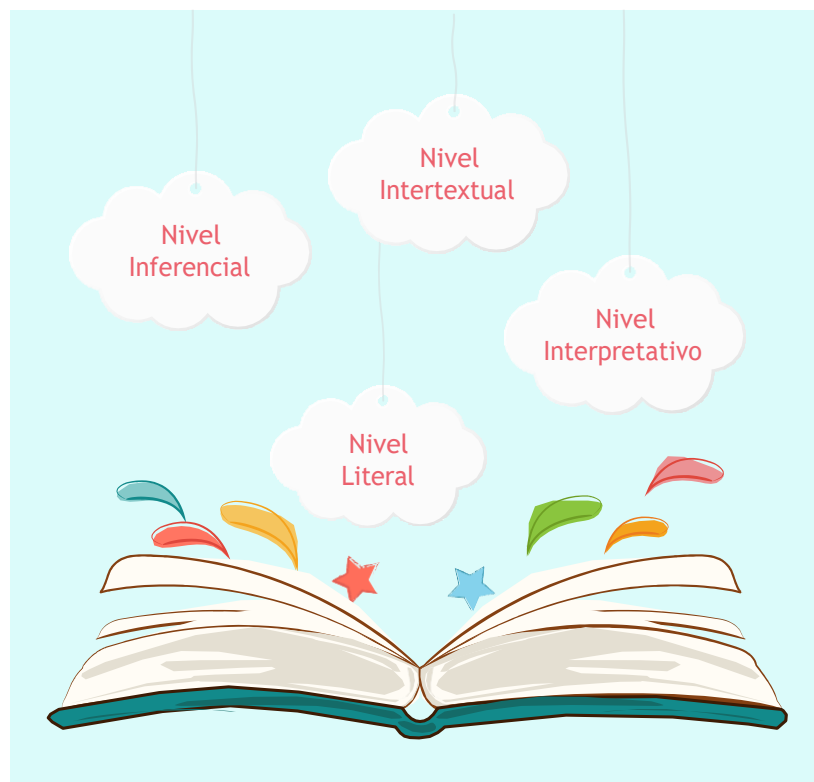
Figura 4.

En cuanto a la lectura, esta requiere de un proceso mental diferente, ya que consiste en la decodificación de textos preparados por otros usuarios del lenguaje. Esta decodificación se da a través de niveles de interpretación para su total comprensión, estos son: