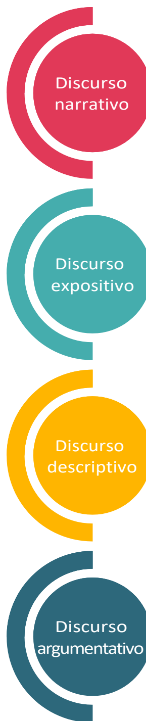
Figura 3. Tipos de discurso

La siguiente gráfica muestra los diferentes tipos de discursos que pueden ser usados para construir nuevas realidades, y a su vez conocimiento, haciendo énfasis en la argumentación .