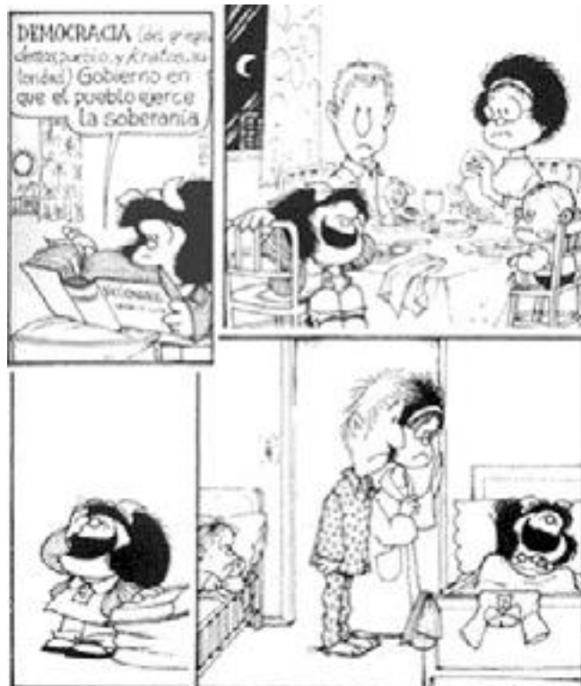
Figura 7. Caricatura de Mafalda sobre pensamiento crítico

Si las tareas de intervención de los textos simulan situaciones cotidianas, la actividad de reflexionar se haría más interesante y lograría una mayor semejanza entre el contexto de la intervención y el cotidiano . El diseñar situaciones de intervención que representen la actividad diaria es una buena manera de mejorar la transferencia de las capacidades intelectuales para ponerlas en práctica en cualquier ámbito . Junto con estas situaciones, es imprescindible generar una práctica de transferencia crítica e interpretativa, con el fin de que se consolide y aplique la capacidad de reflexión .