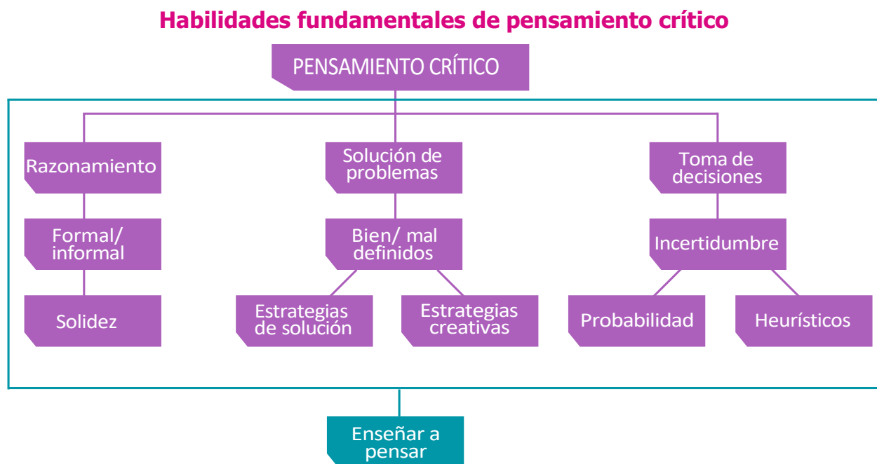
Figura 6. Esquema de pensamiento crítico

Se considera al pensamiento crítico como un proceso de búsqueda del conocimiento, a través de habilidades de razonamiento, solución de problemas y toma de decisiones que permite lograr con la mayor eficacia los resultados deseados, una justificación detallada de la anterior concepción se encuentra en Saiz y Nieto (2002), planteado en el siguiente gráfico: