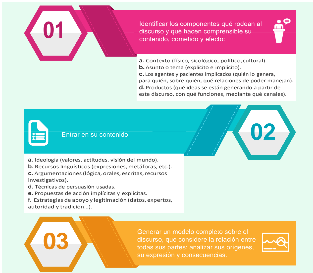
Figura 3. Proceso de un discurso

Por tanto, analizar el discurso implica: