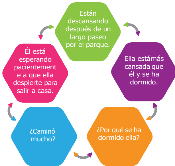
Figura 5.

Mirando la imagen de alguna forma se podría deducir y/o cuestionarnos: