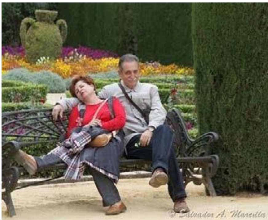
Figura 4. Fotografía para interpretar

Así, por ejemplo, sobre la siguiente imagen de Eva y Adán, tomada en un parque, cada persona puede interpretar cosas diferentes, de acuerdo con sus conocimientos, valores, principios, etc .