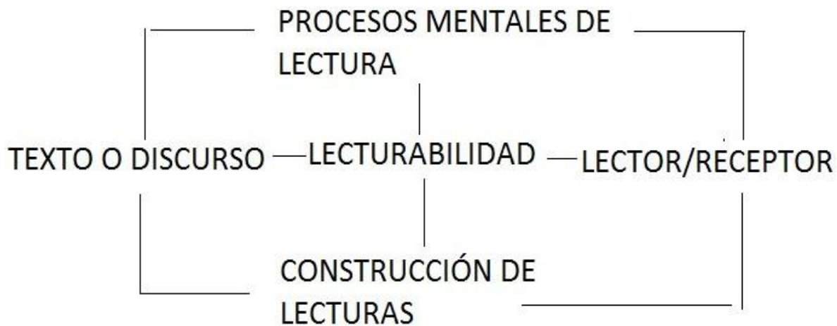
Figura 12. Circuito de la lectura

La complejidad textual radica en el rendimiento lector y su comprensión de la información que extrae de los diferentes textos, y su aplicación en los diferentes contextos en los que los necesite . Es decir, a mayor nivel de comprensión, mayor aplicabilidad en la vida de los conocimientos asimilados a través de los textos interpretados .