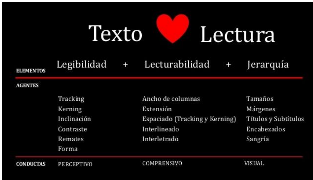
Figura 13. Circuito de la lectura

Es decir, el volumen y la cantidad física del libro sí importa, si es pequeño es mejor, o lo es al menos para una persona que se inicia como lector .