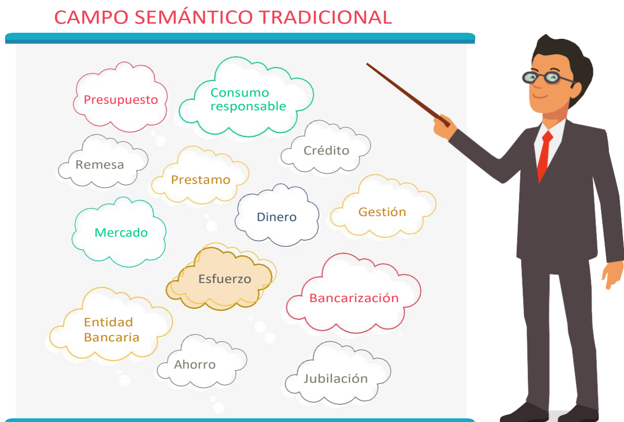
Figura 11. Ejemplo de campo semántico

De acuerdo con la teoría heideggeriana “Los significados no son realidades psíquicas sino contenidos intencionales que se adquieren por el concurso de actos también intencionales” (Heidegger, citado en Aguilar, 1998, p. 44).