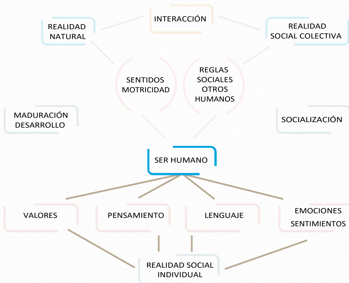
Figura 8. Mapa mental de pensamiento crítico

Todo lo anterior, conduce al ser humano a construir discursos reflexivos en situaciones problemáticas en cualquier disciplina que requieren de elementos e insumos que nutren el mismo y a su emisor, es por esto que utilizamos estrategias como el argumento que es la herramienta por excelencia del lenguaje y que nos permite crearlos a partir de intencionalidades específicas, es importante crear discursos reflexivos, ya que este exige una búsqueda incesante de la verdad frente a diferentes realidades y pensamientos que impactan al ser humano, y que necesariamente lo hacen evolucionar, de esta forma el análisis y la comprensión permanente del lenguaje es el camino para adquirir estas destrezas tan importantes dentro de la sociedad .