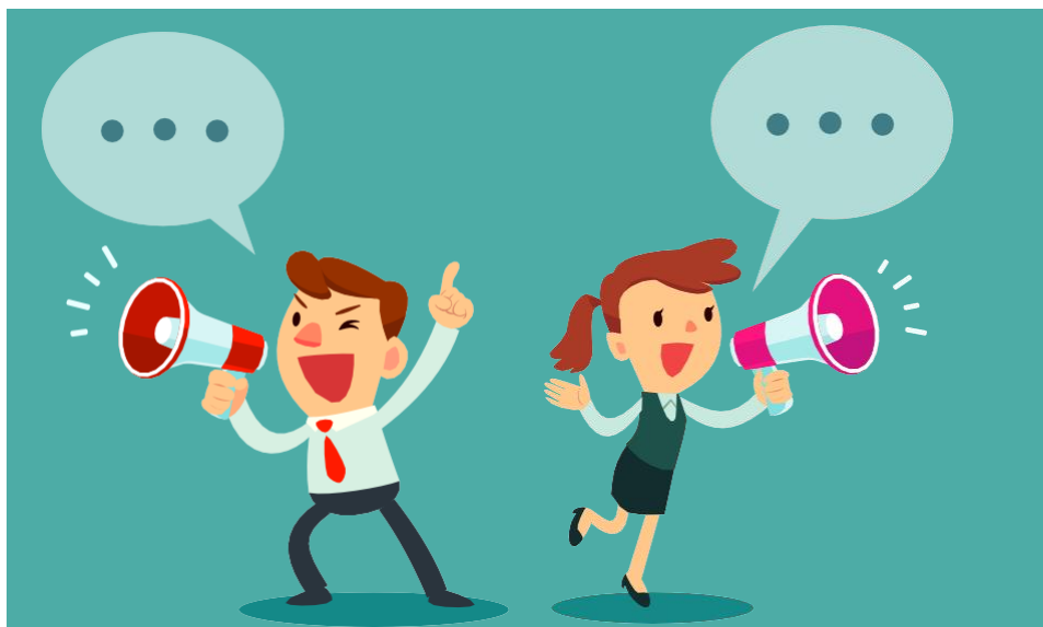
Figura 9.

La elaboración de un discurso está basada en modelos y procesos mentales que se tienen de un evento y, por motivos como: conocer de quien se habla, sus tipos y especificidades de los medios de comunicación y de los recursos de información, que usa sólo para expresar una parte del mensaje, y el resto se deja implícito; otra está en el enunciado y su posterior interpretación y reflexión . Todo lo anterior son los elementos que tiene el ser humano para reconocer intencionalidades y percibir el mensaje enviado, y así responder, ya sea en forma discursiva o a través de las decisiones .