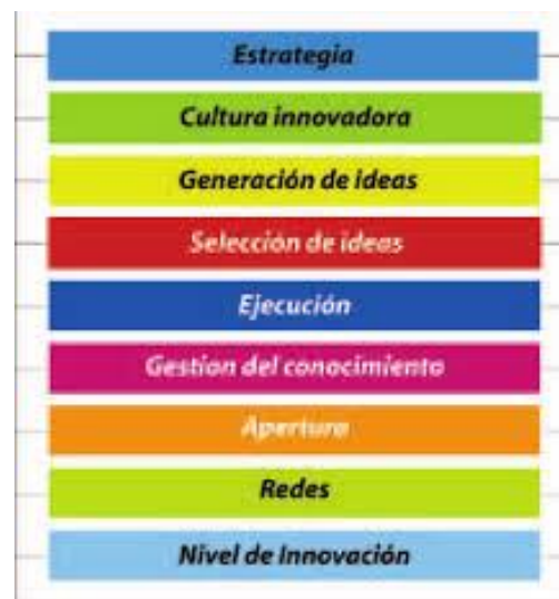
Figura 2. Modelo de innovación

Existe un modelo desarrollado por Solano (2008), denominado el "Modelo de las nueve áreas de la innovación", que muestra una forma práctica de organizar esfuerzos en la organización para incrementar el nivel de innovación, el cual permite a la empresa definir acciones en cada una de ellas.